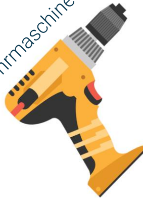
8 mm Bohrer