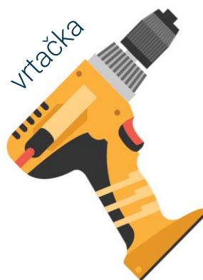
vrták 8 mm